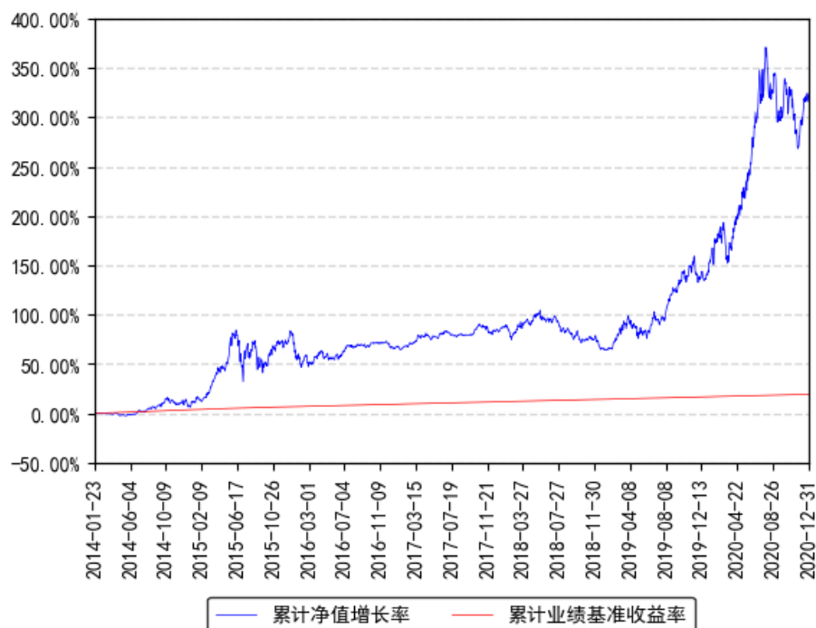
南方医药保健灵活配置混合累计净值增长率与同期业绩比较基准收益率的历史走势对比图