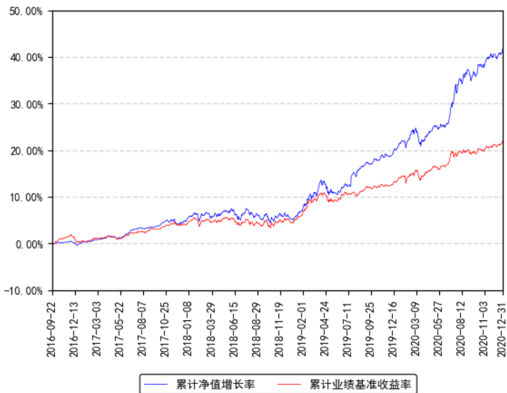
南方安泰混合累计净值增长率与同期业绩比较基准收益率的历史走势对比图