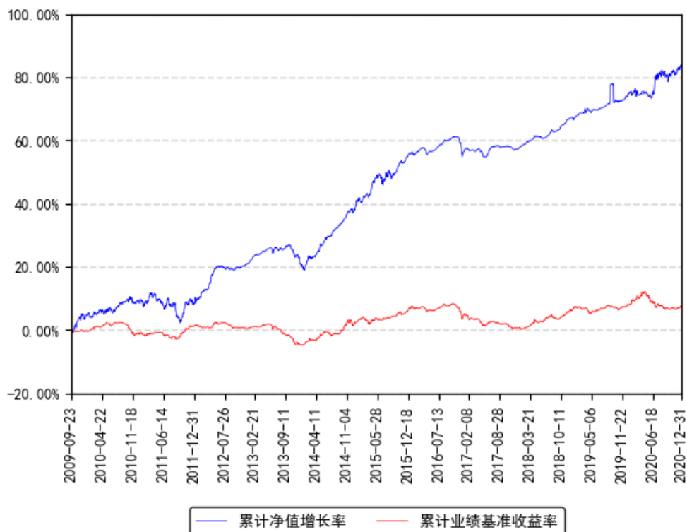
南方多利增强债券A累计净值增长率与同期业绩比较基准收益率的历史走势对比图