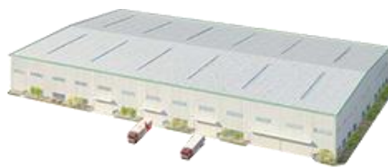
商业电动闸门电机