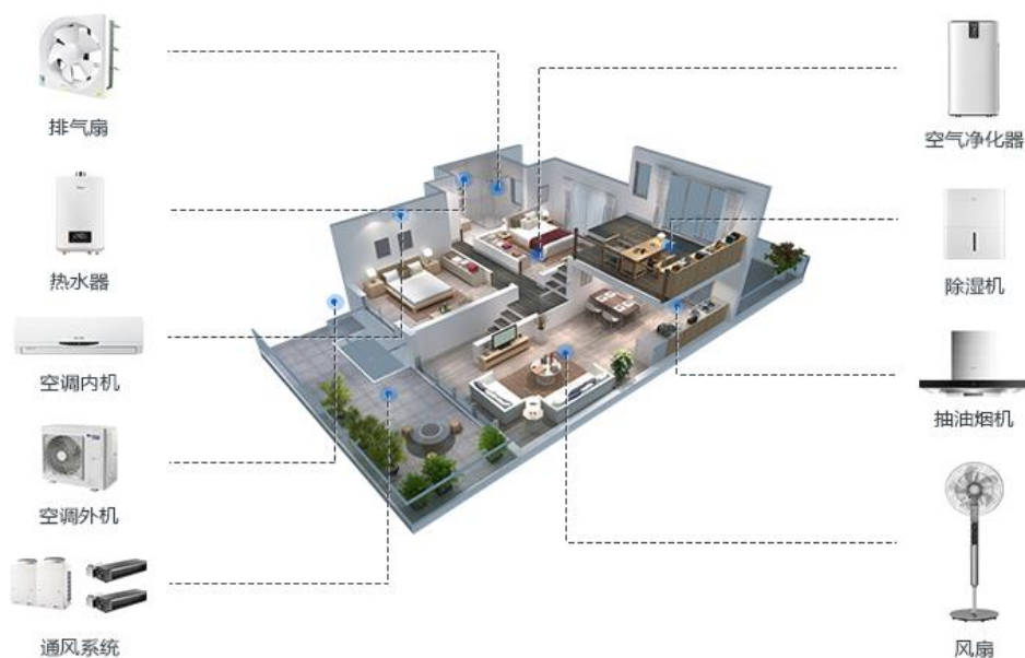
家居电器领域的应用

1、建筑及家居电器电机事业部（BHM事业部）的主要产品：家用/商用空调用电机、建筑通风设备用电机、厨房电器设备用电机、自动车库门用电机、水泵用电机、商用空调用压缩机电机、暖气/通风系统及空调设备用高效率风机系统等。