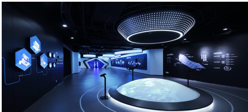
江门人才岛智慧城市展示中心