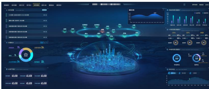
数据可视化展示大屏

视觉云计算： 以瑞云科技为依托，打造为视觉行业提供垂视觉云计算SaaS服务的公司。