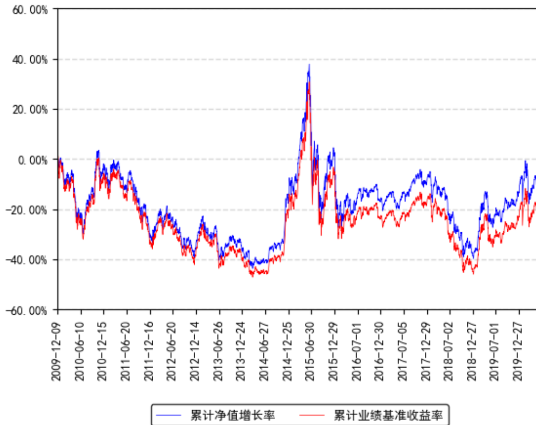
深成联接A累计净值增长率与同期业绩比较基准收益率的历史走势对比图