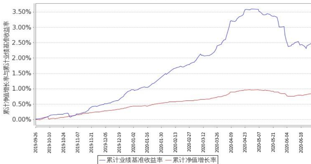
图 2: 嘉实汇鑫中短债债券 C 基金份额累计净值增长率与同期业绩比较基准收益率的历史走势对比图