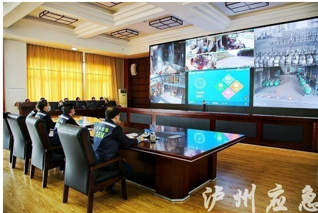
雷曼COB助力泸州市应急管理局