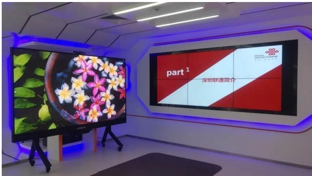
雷曼LEDHUB——中国联通深圳分公司展厅应用方案

计远程办公及智慧会议市场在未来几年快速增长，超大屏超高清视频会议系统有望发展成为一个新的蓝海市场，雷曼智慧会议系统LEDHUB，为远程高效沟通量身打造。作为远程办公会议市场的有力竞争者，在屏幕技术、系统等方面具备较好优势，该业务有望成为公司未来的发力点及增长点。