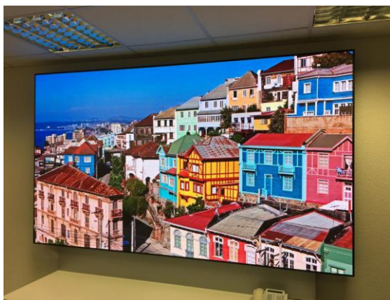
法兰克福知名德企的雷曼P1.2COB超高清显示屏

沉浸式视觉体验。雷曼光电COB超高清显示屏凭借其显示效果及航天级专业品质屡获海内外客户的青睐，得到了客户的肯定与认可。未来，雷曼光电将继续为全球客户提供行业一流的超高清Micro LED显示产品，坚持“中国智造”高品质，打造全场景覆盖，高环境适应的超高清显示解决方案新标杆。