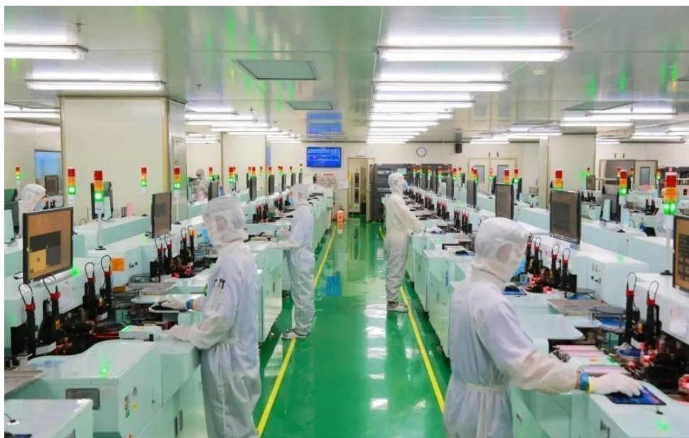
惠州雷曼Micro LED自动化生产车间

面对新冠肺炎疫情，公司密切关注疫情发展和前线抗疫工作，快速成立企业防控小组，布局及制定企业防控战略方案，开展细化企业防疫网格，全面落实员工核查、隔离监控、健康监测、物质保障、消杀保洁工作。并采取智能远程办公、错峰用餐等方式避免群体聚集，全体员工上下合力，共克时艰，在节后如期有序复工复产。同时积极承担社会责任，响应政府号召，本着源于社会、回报社会的精神，向雄安新区下辖雄县、安新、容城等三县捐赠节能环保LED灯管1500支，医院用高效节能面板灯330套，用于支援雄安新区下辖三县负压隔离病房项目以及其它医疗防疫建设项目，助力打赢“新冠肺炎防疫攻坚战”。