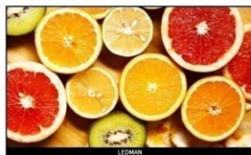
108吋 4K Micro LED