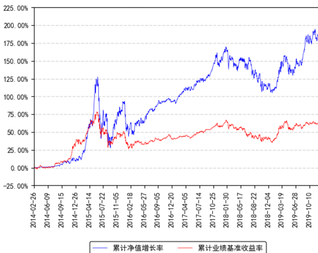
南方新优享A累计净值增长率与同期业绩比较基准收益率的历史走势对比图