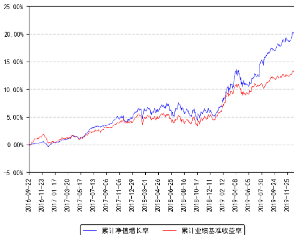
南方安泰混合累计净值增长率与同期业绩比较基准收益率的历史走势对比图