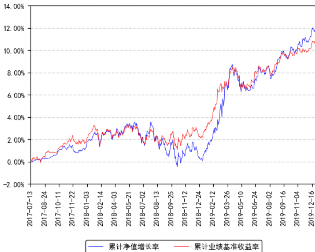
南方安睿混合累计净值增长率与同期业绩比较基准收益率的历史走势对比图