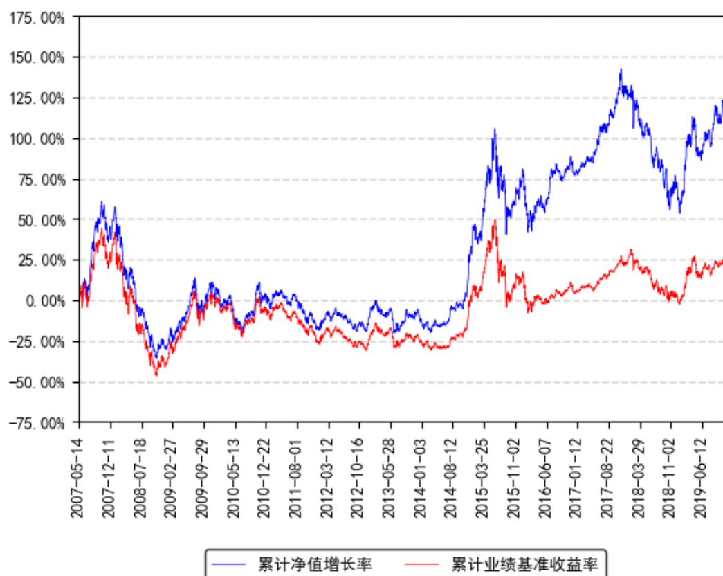
南方成份A累计净值增长率与同期业绩比较基准收益率的历史走势对比图