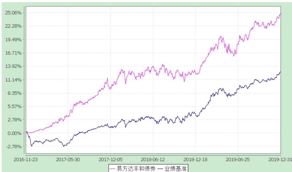
份额累计净值增长率与业绩比较基准收益率历史走势对比图 (2016 年 11 月 23 日至 2019 年 12 月 31 日)

注：自基金合同生效至报告期末，基金份额净值增长率为 25.01%，同期业绩比较基准收益率为 12.87%。