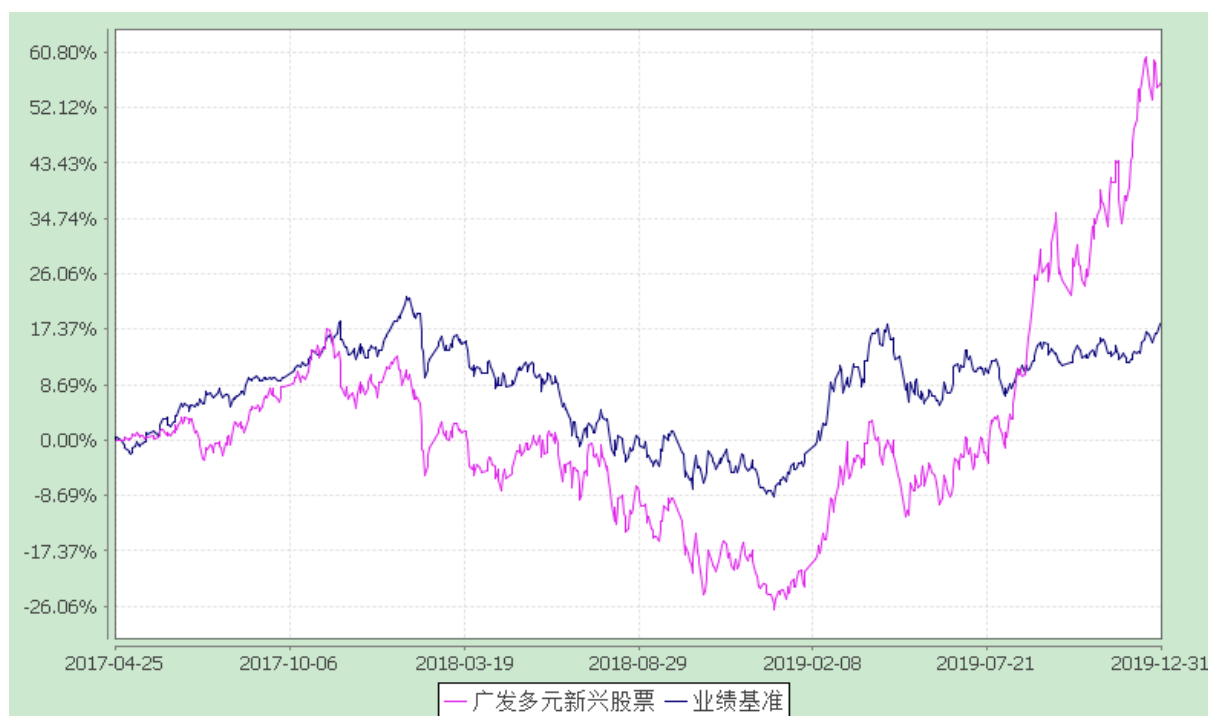
广发多元新兴股票型证券投资基金 份额累计净值增长率与业绩比较基准收益率的历史走势对比图 (2017 年 4 月 25 日至 2019 年 12 月 31 日)