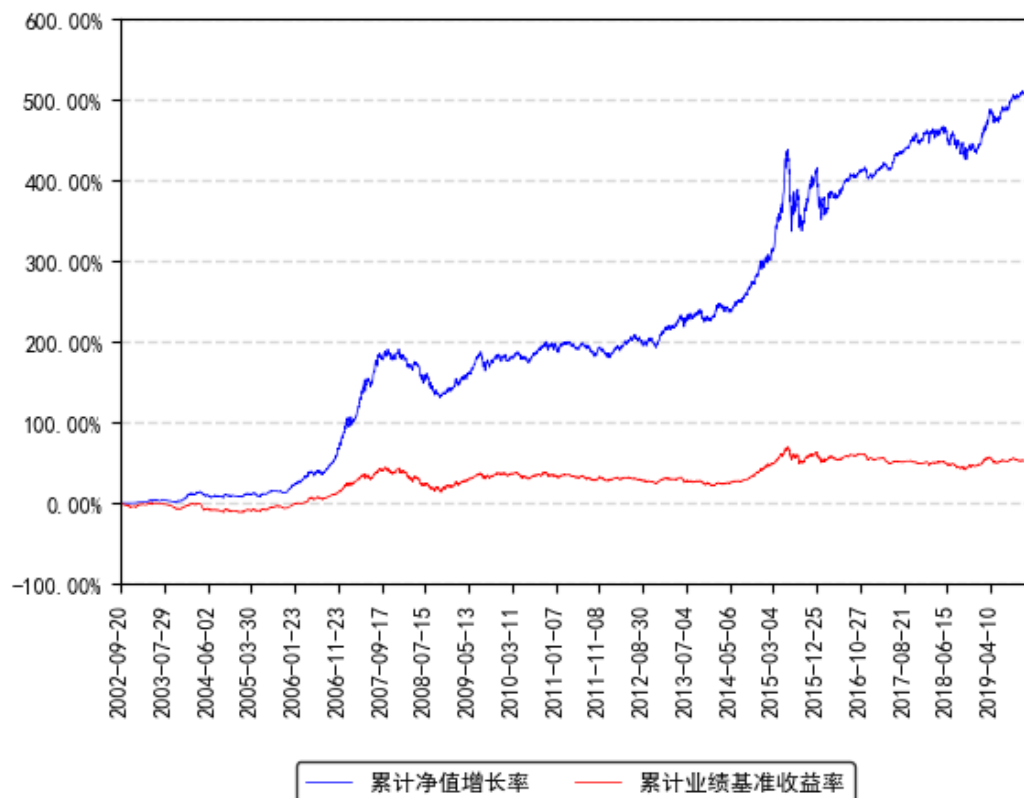
南方宝元债券A累计净值增长率与同期业绩比较基准收益率的历史走势对比图