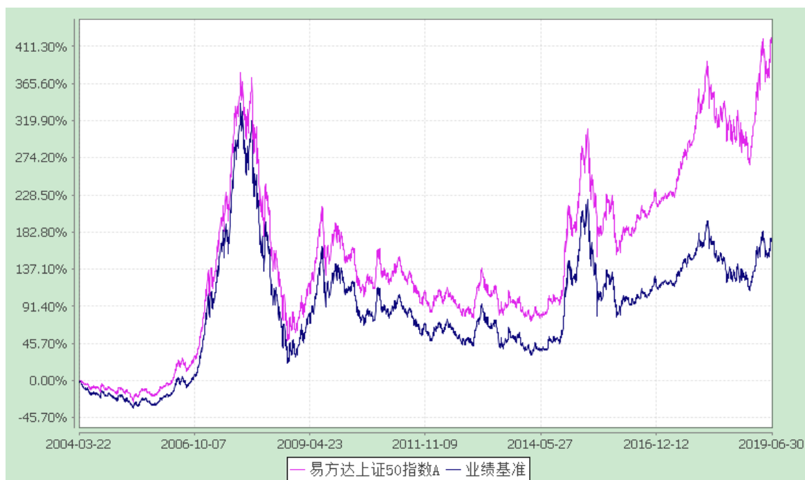
易方达上证 50 指数 C