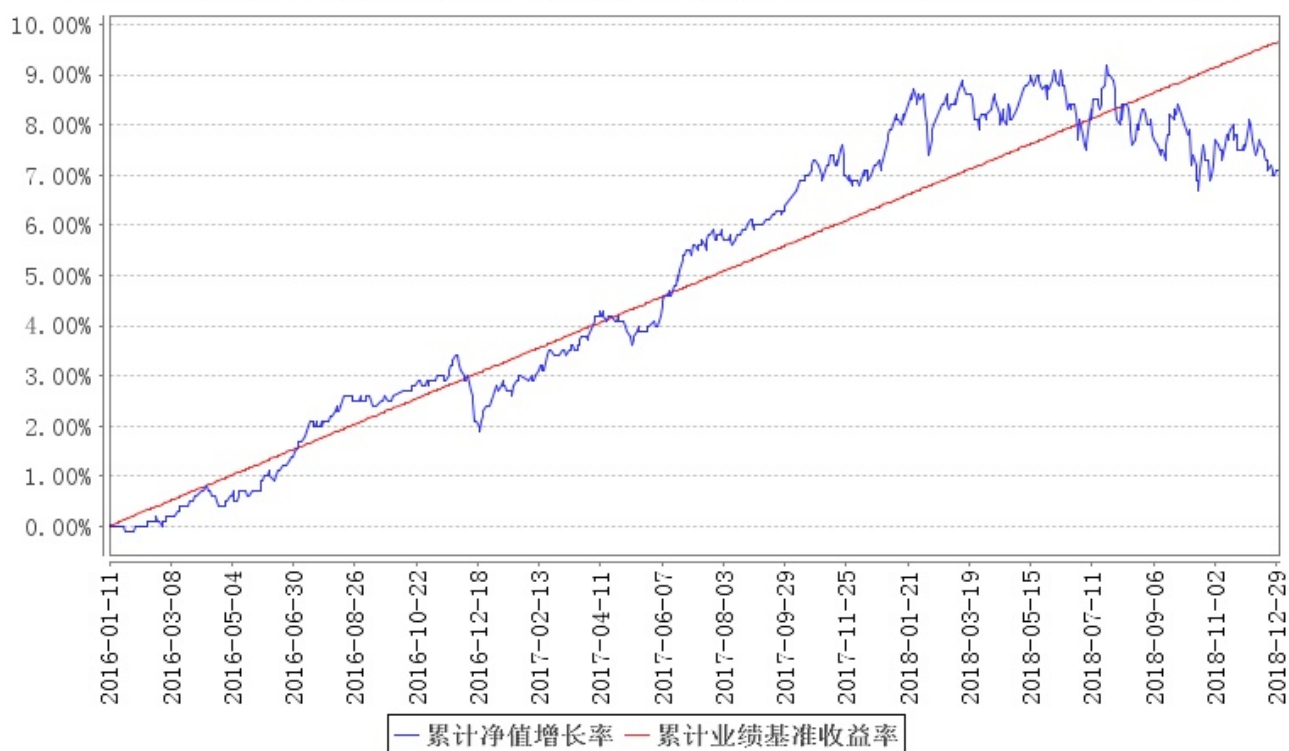
南方益和混合累计净值增长率与同期业绩比较基准收益率的历史走势对比图

注：1、本基金的建仓期为六个月，建仓结束时各项资产配置比例符合合同约定。2、本基金的第一个保本期为三年，自2016年1月11日至2019年1月11日止。