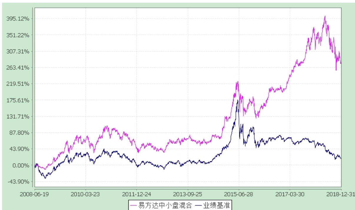
易方达中小盘混合型证券投资基金 份额累计净值增长率与业绩比较基准收益率历史走势对比图 (2008 年 6 月 19 日至 2018 年 12 月 31 日)

注：自基金合同生效至报告期末，基金份额净值增长率为 276.79%，同期业绩比较基准收益率为 18.49%。