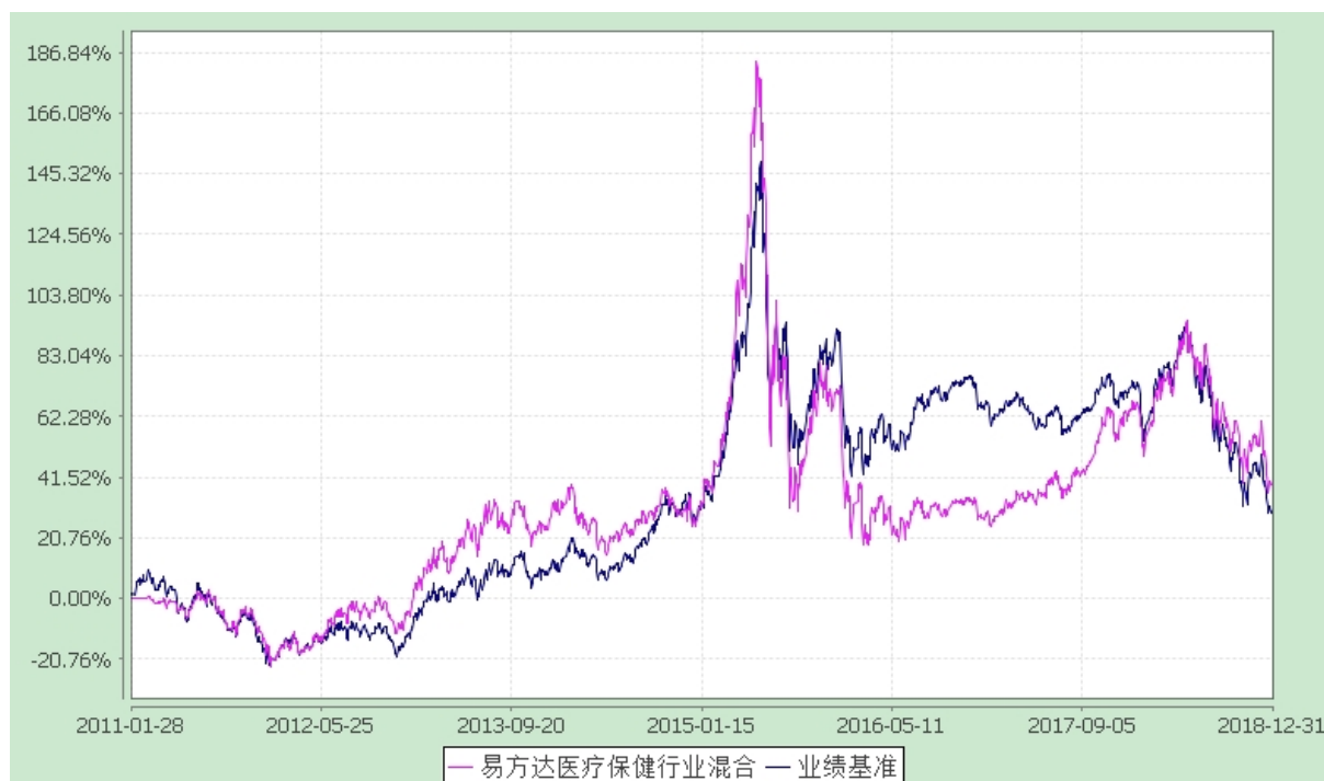
易方达医疗保健行业混合型证券投资基金 份额累计净值增长率与业绩比较基准收益率历史走势对比图 (2011 年 1 月 28 日至 2018 年 12 月 31 日)

注：自基金合同生效至报告期末，基金份额净值增长率为 39.10%，同期业绩比较基准收益率为 30.08%。