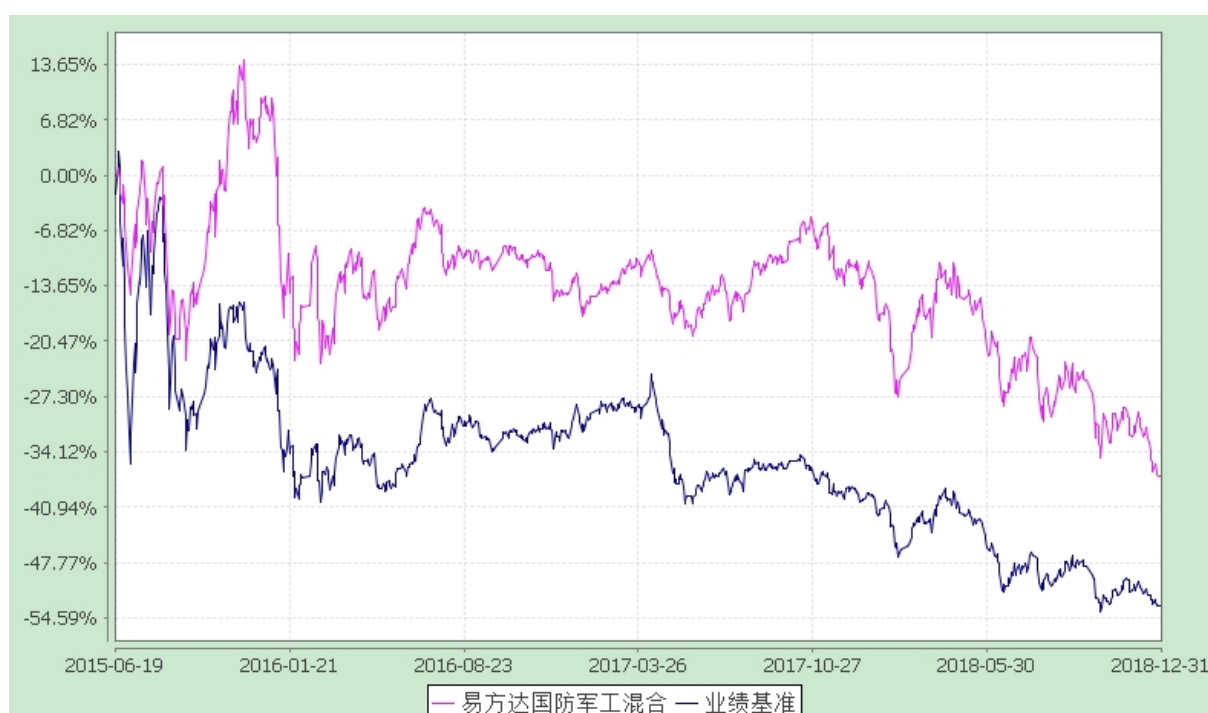
易方达国防军工混合型证券投资基金 份额累计净值增长率与业绩比较基准收益率历史走势对比图 (2015年6月19日至2018年12月31日)

注：自基金合同生效至报告期末，基金份额净值增长率为-37.10%，同期业绩比较基准收益率为-53.04%。