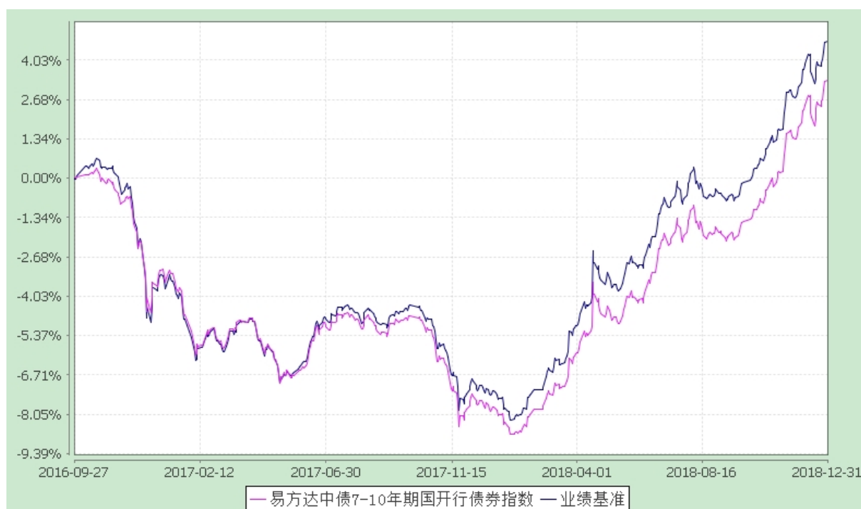
易方达中债 7-10 年期国开行债券指数证券投资基金 份额累计净值增长率与业绩比较基准收益率历史走势对比图 (2016 年 9 月 27 日至 2018 年 12 月 31 日)

注：自基金合同生效至报告期末，基金份额净值增长率为 3.34%，同期业绩比较基准收益率为 4.68%。