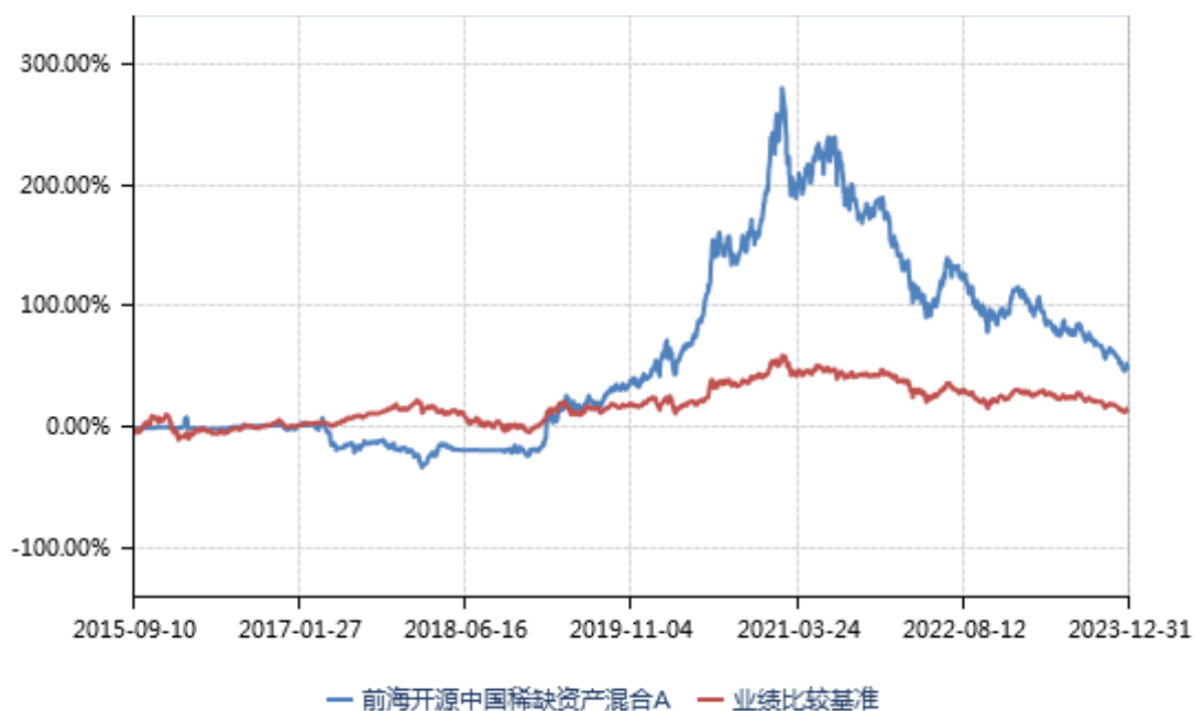
前海开源中国稀缺资产混合 C