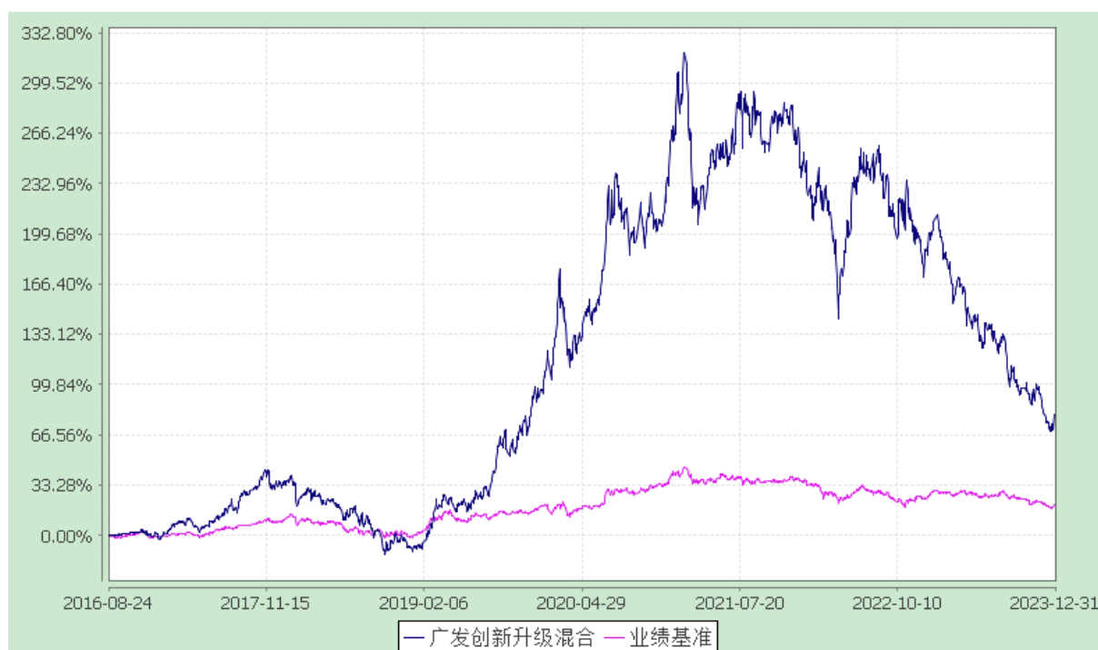
广发创新升级灵活配置混合型证券投资基金 份额累计净值增长率与业绩比较基准收益率的历史走势对比图 (2016年8月24日至2023年12月31日)