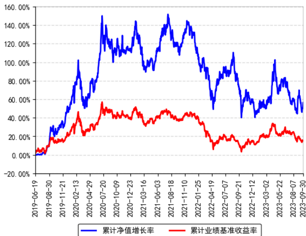
南方信息创新混合A累计净值增长率与同期业绩比较基准收益率的历史走势对比图