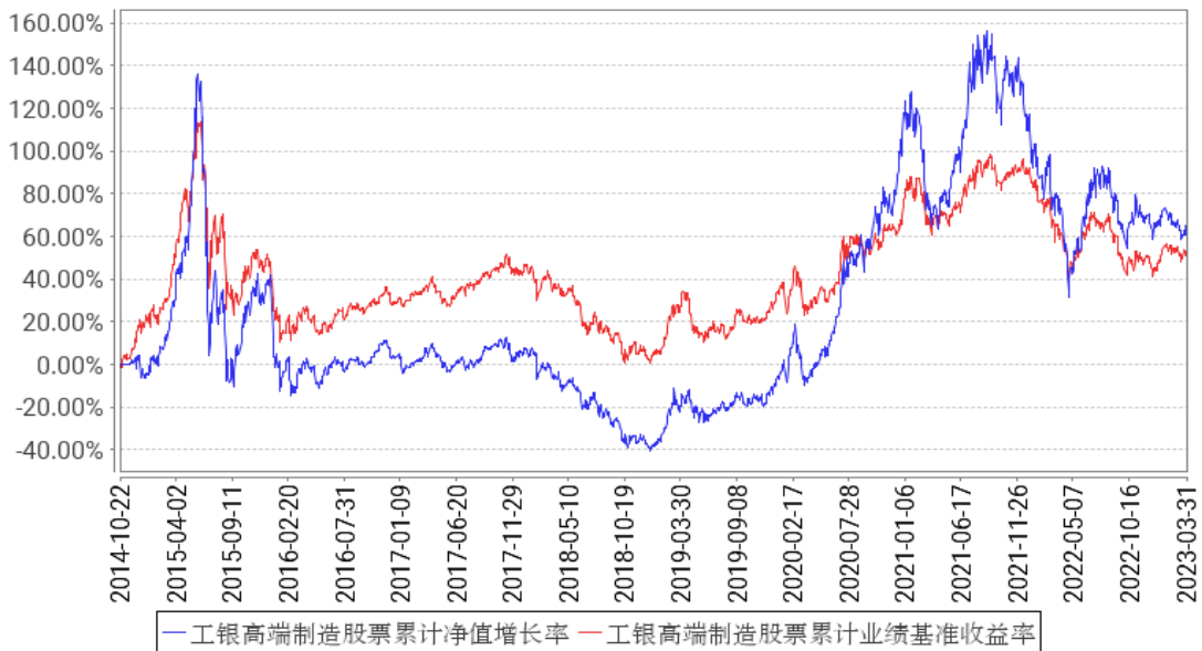
工银高端制造股票累计净值增长率与同期业绩比较基准收益率的历史走势对比图