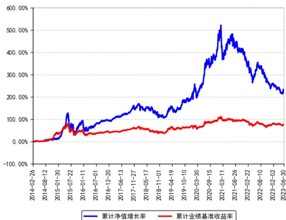
南方新优享灵活配置混合A累计净值增长率与同期业绩比较基准收益率的历史走势对比图