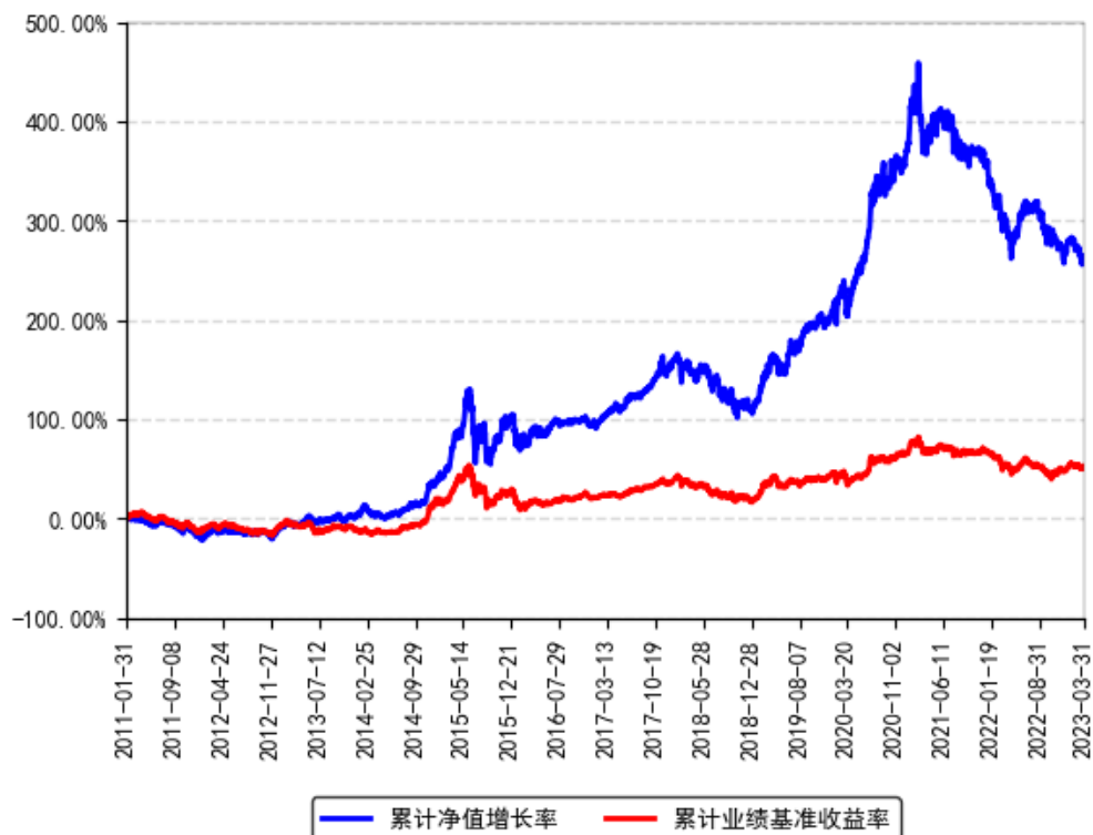
南方优选成长混合A累计净值增长率与同期业绩比较基准收益率的历史走势对比图