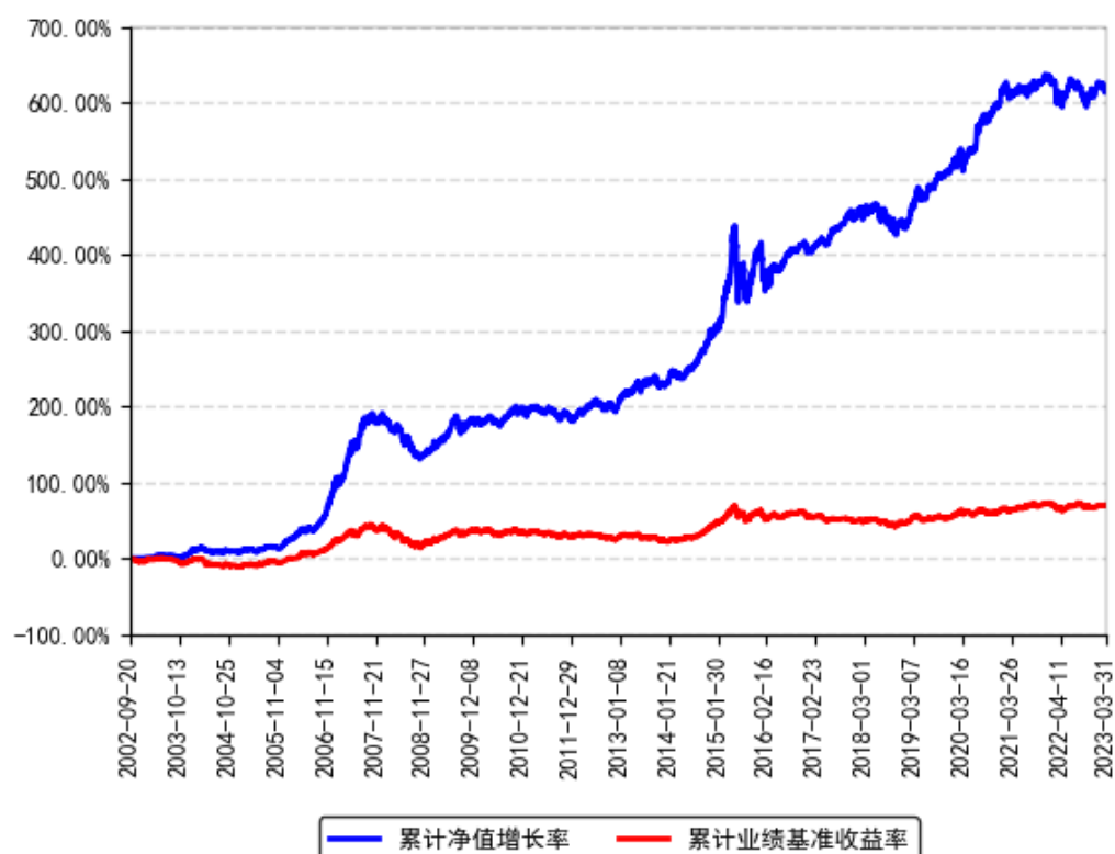
南方宝元债券A累计净值增长率与同期业绩比较基准收益率的历史走势对比图