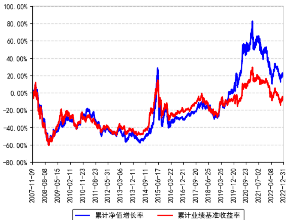
南方隆元产业主题混合累计净值增长率与同期业绩比较基准收益率的历史走势对比图

注：本基金自 2007 年 11 月 09 日由封闭式基金隆元证券投资基金转型而成。