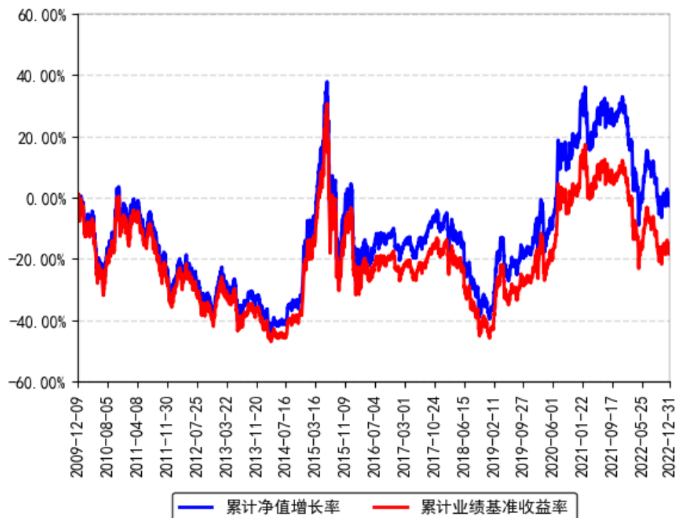
南方深证成份ETF联接A累计净值增长率与同期业绩比较基准收益率的历史走势对比图