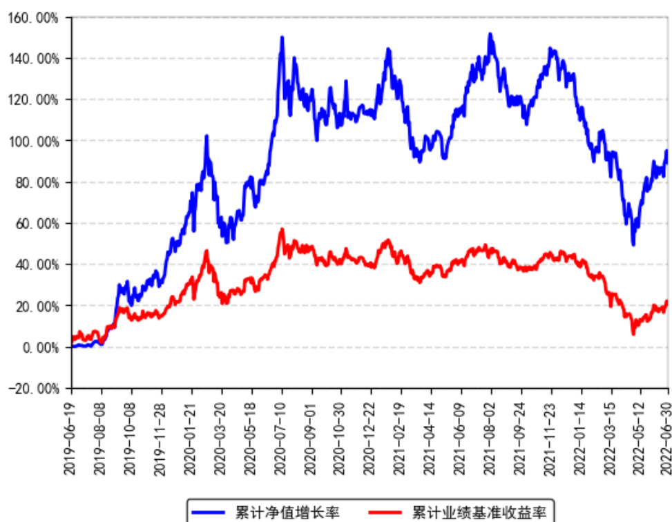
南方信息创新混合A累计净值增长率与同期业绩比较基准收益率的历史走势对比图