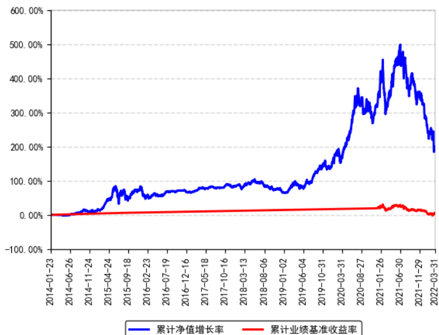
南方医药保健灵活配置混合A累计净值增长率与同期业绩比较基准收益率的历史走势对比图