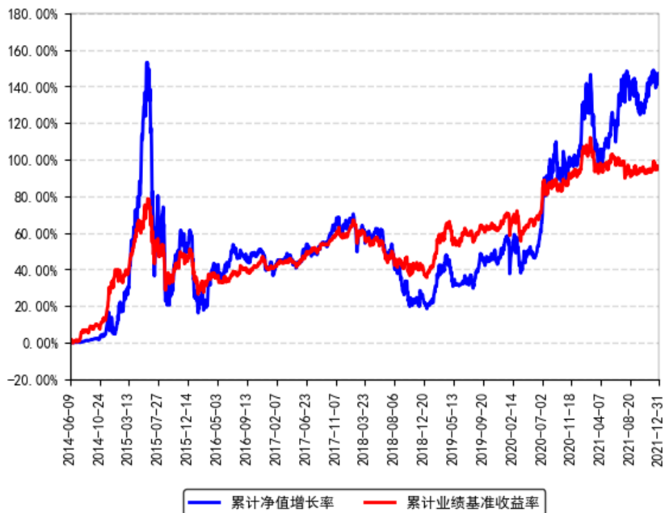
中国梦灵活配置混合累计净值增长率与同期业绩比较基准收益率的历史走势对比图