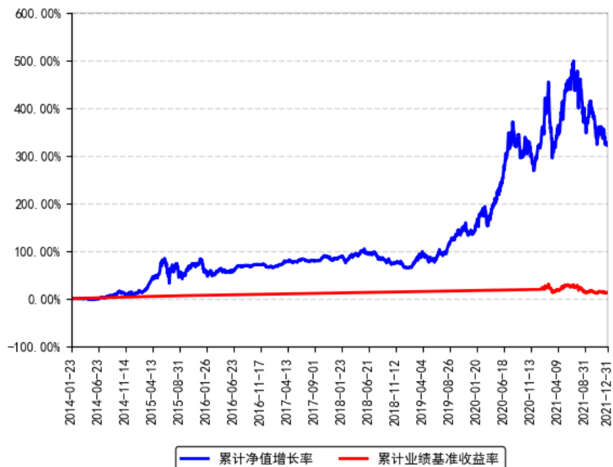
南方医药保健灵活配置混合A累计净值增长率与同期业绩比较基准收益率的历史走势对比图

注：根据《关于南方医药保健灵活配置混合型基金变更业绩比较基准并修订基金合同的公告》，自基金合同生效日起至 2020 年 12 月 31 日止，本基金的业绩比较基准为“1 年期银行定期存款利率(税后)+1%”；自 2021 年 1 月 1 日起至本报告期末止，本基金的业绩比较基准变更为“中证医药卫生指数收益率×60%+上证国债指数收益率×40%”。