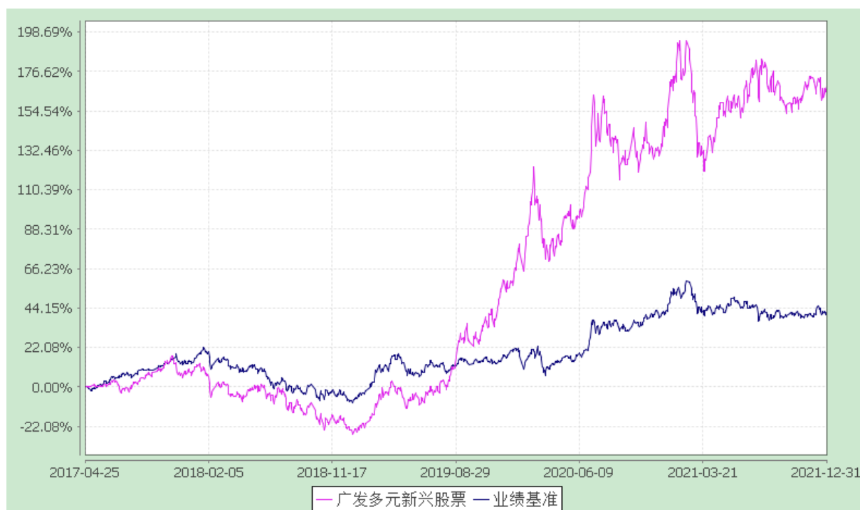
广发多元新兴股票型证券投资基金 份额累计净值增长率与业绩比较基准收益率的历史走势对比图 (2017 年 4 月 25 日至 2021 年 12 月 31 日)